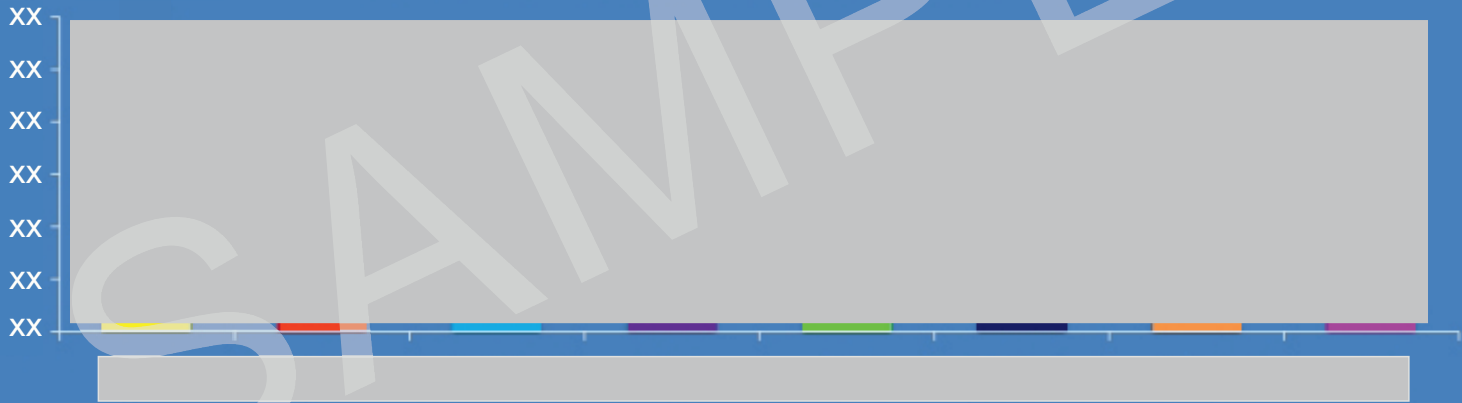
نمودار سهم بازار برندهای کره گیاهی در سال ۱۴۰۰ N=4166

بررسی و شناخت سهم بازار برندهای مختلف در بازار بر اساس تعداد فروش (VOLUME SHARE) از شاخص های اصلی برآورد رقابت بازار محسوب می شود. البته این سنجش بایستی سالی حداقل دو بار و به صورت طولی ادامه داشته باشد تا بتوان به روند آن دست یافت. نمودار زیر سهم بازار برندهای مختلف کره گیاهی را نشان می دهد.